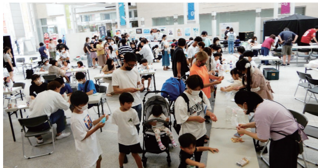
サイエンス屋台村会場の様子

福島大学わくわくJrカレッジ「サイエンス屋台村」は、来年度以降も開催を予定しており、イベントを通して地域に貢献するとともに、子どもたちに学びの楽しさを伝えていきます。