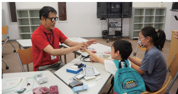
光通信システム工作