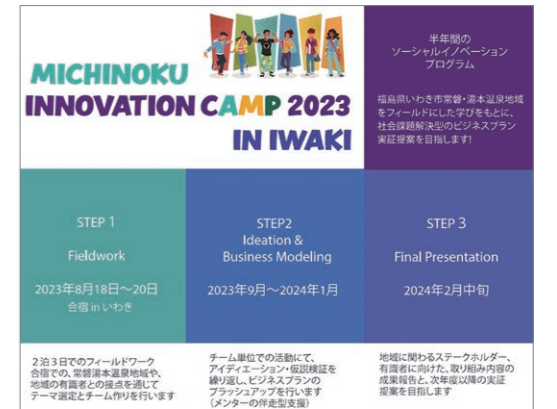
みちのくイノベーションキャンプの取り組み

地域未来デザインセンターソーシャルデザイン開発部門では、今後も社会課題解決型のイノベーション人材育成の取り組みを進めてまいります。