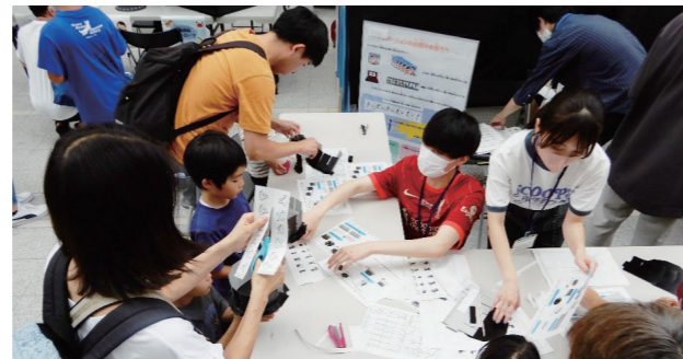
ゾートロープ工作