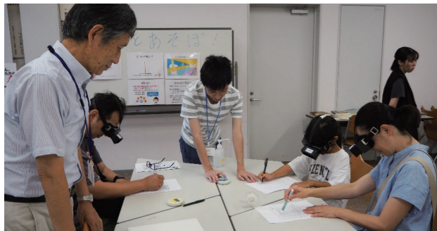
逆さメガネを用いた迷路解き