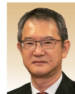
福島大学 共生システム理工学類長