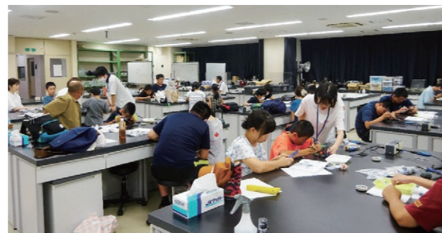
ロボット工作教室会場の様子